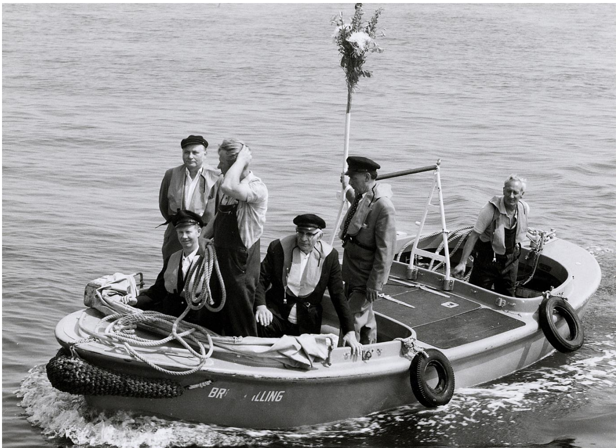
Letzte Ablösung auf dem Leuchtturm Hohe Weg 2.Juli 1973

So übergebe ich hiermit die Fernsteuerung der Seezeichen an der Außenweser dem Betrieb und erteile der Revierzentrale in Bremerhaven den Auftrag, die Leuchtfeuer einzuschalten.