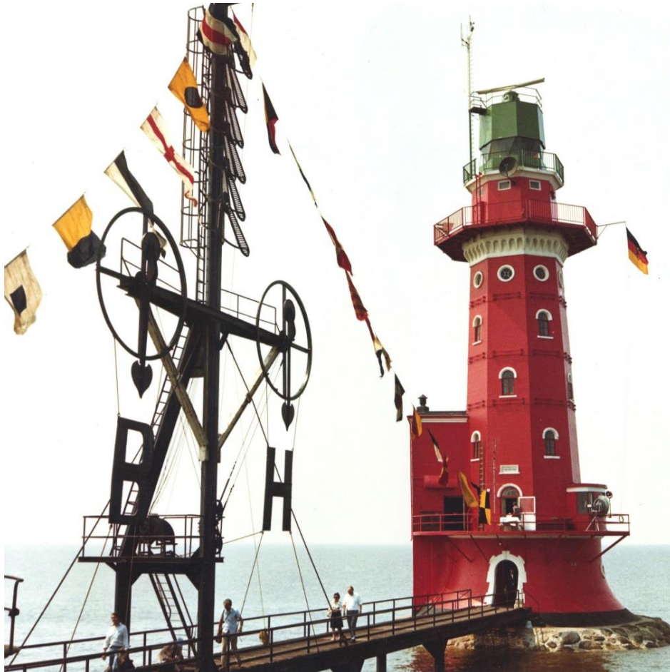
Leuchtturm Hohe Weg am 2.Juli 1973

Zur Erinnerung an die Zeit, als es den Beruf des Leuchtfeuerwärters noch gab.